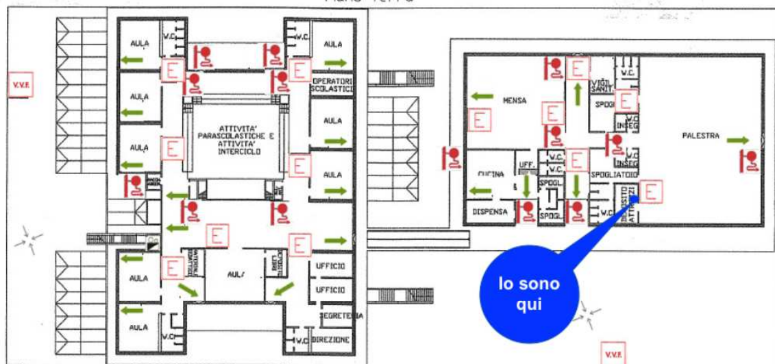
PIANTA DI EMERGENZA Scuola elementare "S. G. Bosco" Piano Terra