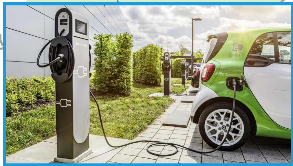
L'immagine rappresenta una colonnina di ricarica

Parcheggio interscambio/multipiano Via Risorgimento/Viale Salvo D'Acquisto Area possibile di intervento: 1.100 mq Piani: 3÷4 piani fuori terra Possibili posti auto: 100÷120 stalli